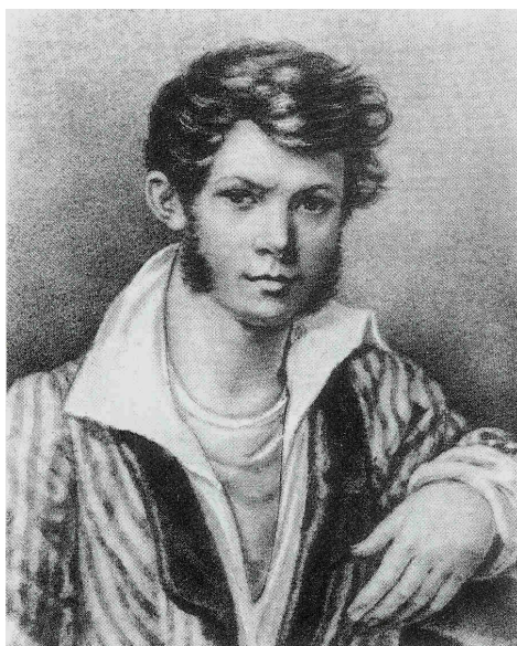
П. А. Вяземский С портрета И. Зонтага. Варшава, 1821 г.

За период с 1821 по 1829 им создано большое количество стихотворений, эпиграмм, литературно-критических статей. Среди опубликованных работ были рецензии на поэмы «Кавказский пленник», «Бахчисарайский фонтан» и «Цыганы», содействовавшие литературному успеху А. С. Пушкина.