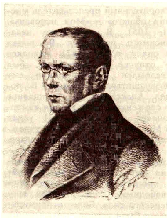
П. А. Вяземский С портрета Ф. Фон Витцлебена. 1853 г.

В конце 1852 года к князю Петру Андреевичу вернулась муза поэзии: он начал писать стихи. В дороге им были созданы «Прага», «Фрейберг», «Дрезден», «Ночью на железной дороге между Прагою и Веною», «Зонненштейн», «Петр I в Карлсбаде», «Александрийский стих», «Одно сокровище», доработана «Палестина», начата в августе 1850 г.