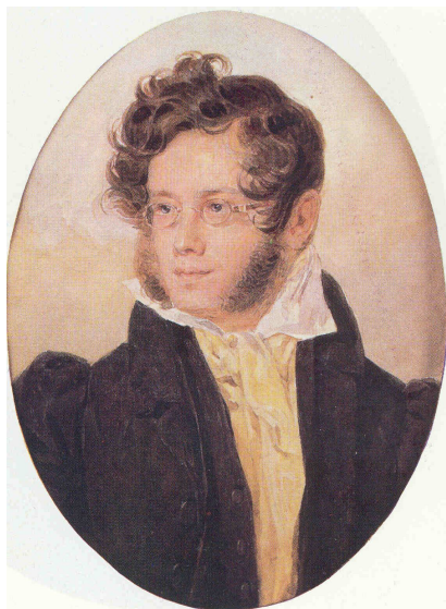
П. А. Вяземский Художник П. Ф. Соколов. 1818–1820 гг.

С окончанием войны возобновились литературные баталии. Единомышленники П. А. Вяземского продолжили свои выступления против сторонников «Беседы». Уже тогда князь Петр Андреевич задумывался над созданием своего литературного общества и изданием журнала, который мог бы стать орудием воздействия на общественное мнение. В середине октября 1815 года в Санкт-Петербурге состоялось первое организационное заседание «Арзамасского общества безвестных людей». В него вошли Д. Н. Блудов, Д. В. Дашков, А. И. Тургенев, С. С. Уваров, В. А. Жуковский, С. П. Жихарев, Д. Н. Северин. В Москве был создан филиал общества, членами которого стали П. А. Вяземский, В. Л. Пушкин, Н. М. Карамзин, И. И. Дмитриев, а так же проживавшие в других местностях России Д. В. Давыдов и К. Н. Батюшков. Главной фигурой, которая воплощала общественные и нравственные идеалы «Арзамаса», являлся Н. М. Карамзин.