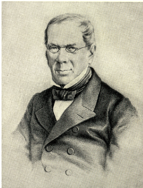
П. А. Вяземский фотография 1869 года

В 1874 г. в альманахе «Складчина» появилась большая подборка его стихотворений. В 1876 г. написан поэтический цикл «Хандра с проблесками».