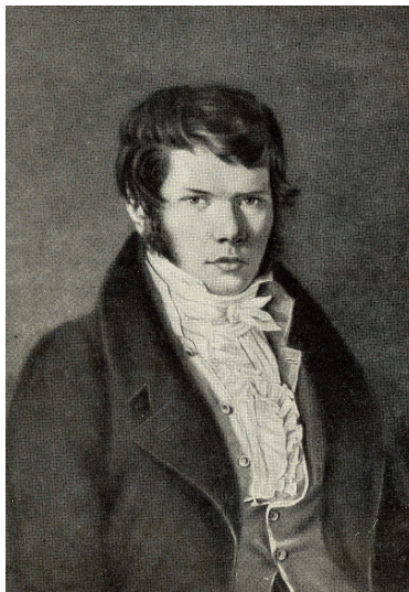
П. А. Вяземский С портрета К. Ф. Рейхеля 1817 года

В эти незабываемые годы П. А. Вяземский завел знакомство с В. А. Жуковским, А. И. Тургеневым, К. Н. Батюшковым, Д. В. Дашковым, Д. Н. Блудовым, А. А. Перовским, Д. В. Давыдовым, В. Л. Пушкиным, графом М. Ю. Виельгорским.