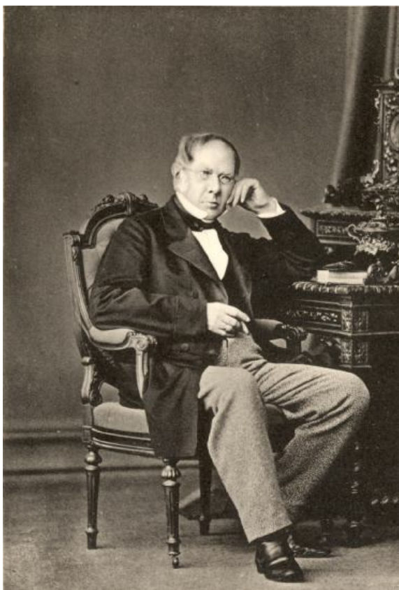
П. А. Вяземский Фотография 1875 г. (Гомбург)

В год окончания войны П. А. Вяземского не стало. Он скончался в Баден-Бадене (Германия) 10 (22) ноября 1878 года в возрасте 86 лет. Прах его был перевезен в Санкт-Петербург и похоронен в Александро-Невской лавре рядом с В. А. Жуковским и Н. М. Карамзиным.