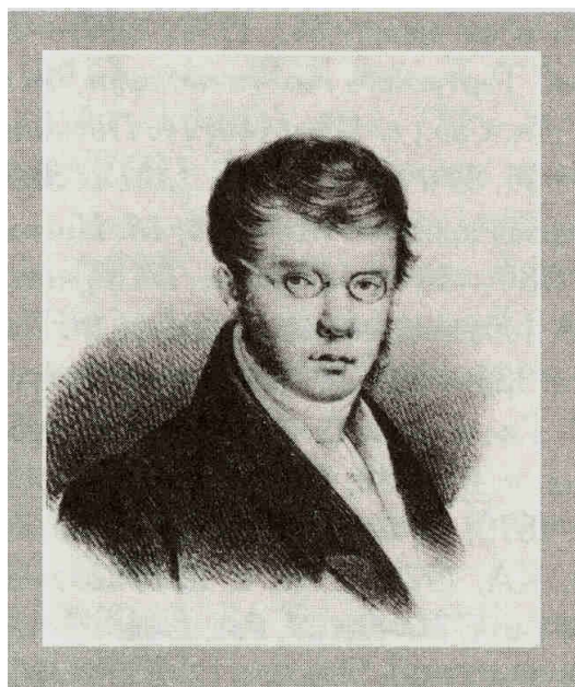
П. А. Вяземский Неизвестный художник с оригинала И. Вивьена. 1820-е гг.

Довольно скоро П. А. Вяземский понял, что слова императора расходятся с делом: проект Конституции и записка об отмене крепостного права написаны всего лишь «для блезиру», не более. В Царстве Польском, да и по всей России продолжался произвол властей и попрание всех норм человеческого общежития. П. А. Вяземский в своих письмах резко критиковал политику Александра I. О том, что корреспонденция перлюстрируются, князь Петр Андреевич знал, но продолжал писать открыто и нелицеприятно.